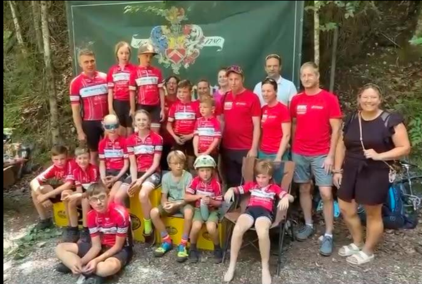
Unser Team samt Eltern und Fans.