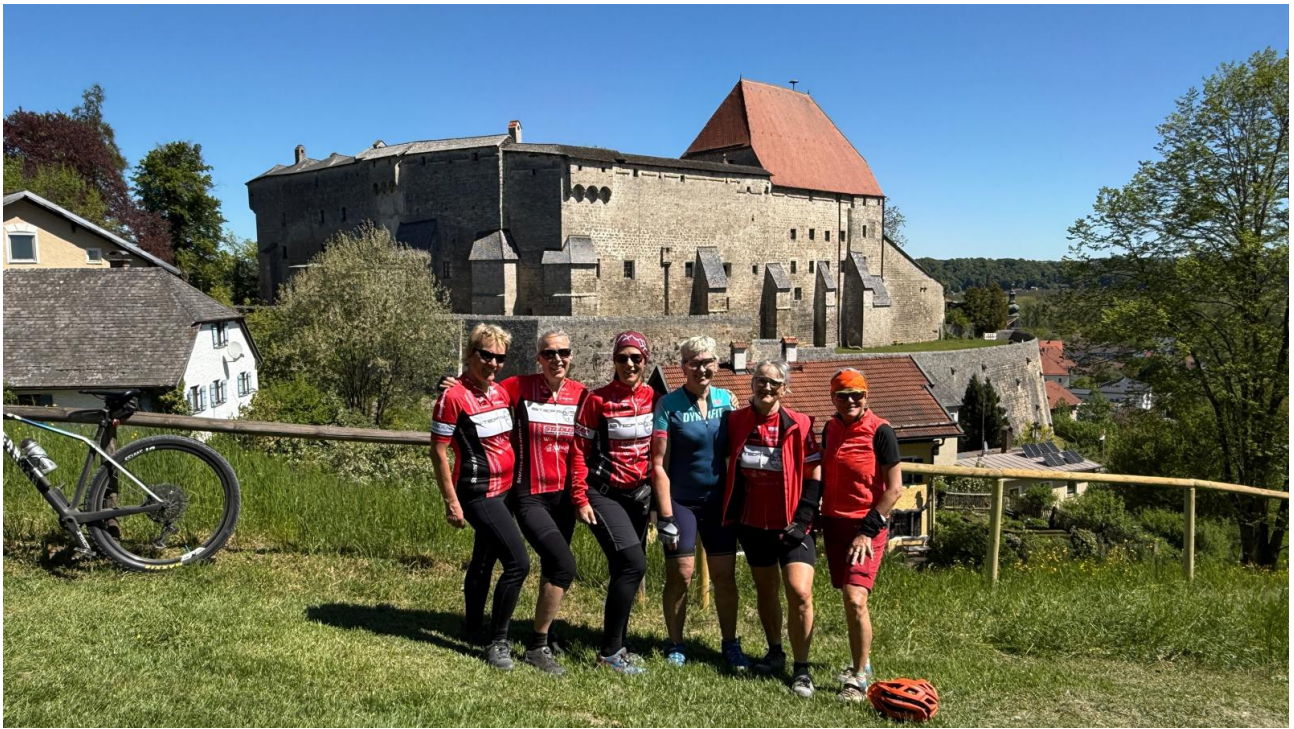
Nach einer kurzen Rast oberhalb der Burg