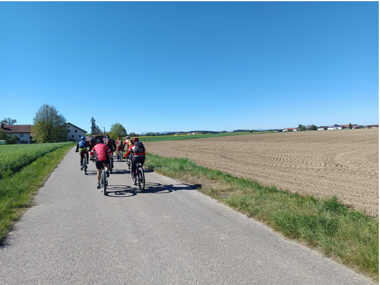
Nachdem alle gut gespeist hatten, machten wir uns auf den gemeinsamen Rückweg