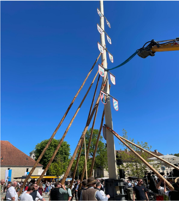
Maibaumaufstellen in Reitenhaslach