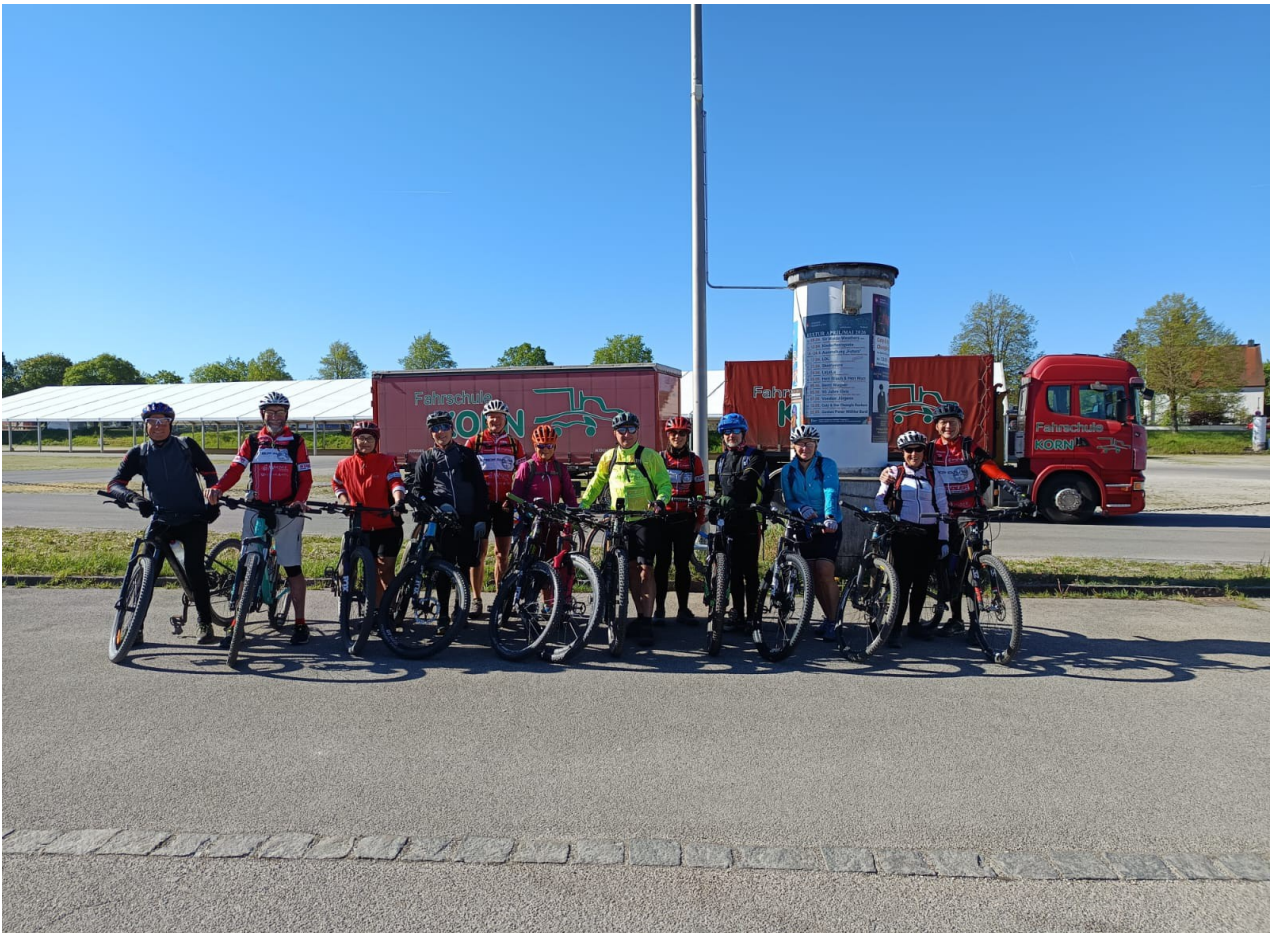
Bei Bilderbuchwetter waren pünktlich um 9 Uhr morgens alle Teilnehmer am Volksfestplatz in Mühlendorf startklar.