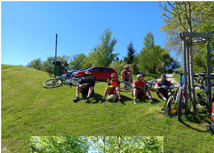
machte sich die Gruppe wieder auf den Weg