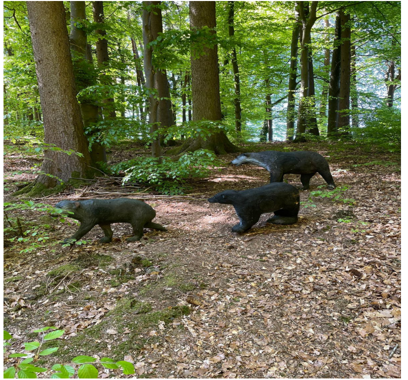
vorbei an „wilden Tieren“