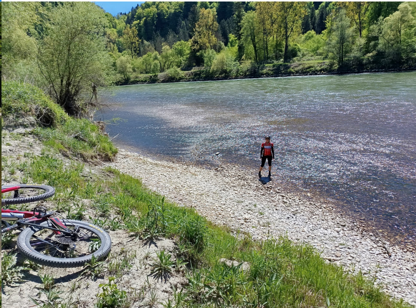
Entlang der Salzach führte uns unser Weg zum nächsten Ziel