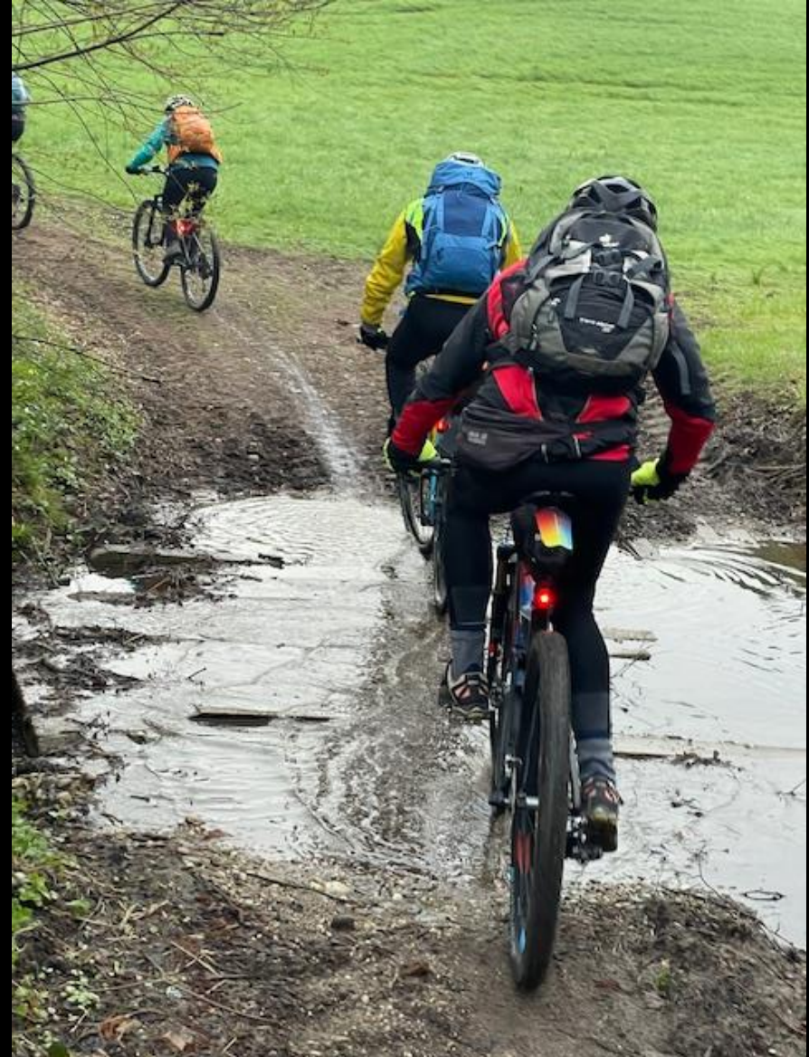
Es folgten kleine Highlights wie eine Bachdurchquerung -die alle gut meisterten-,