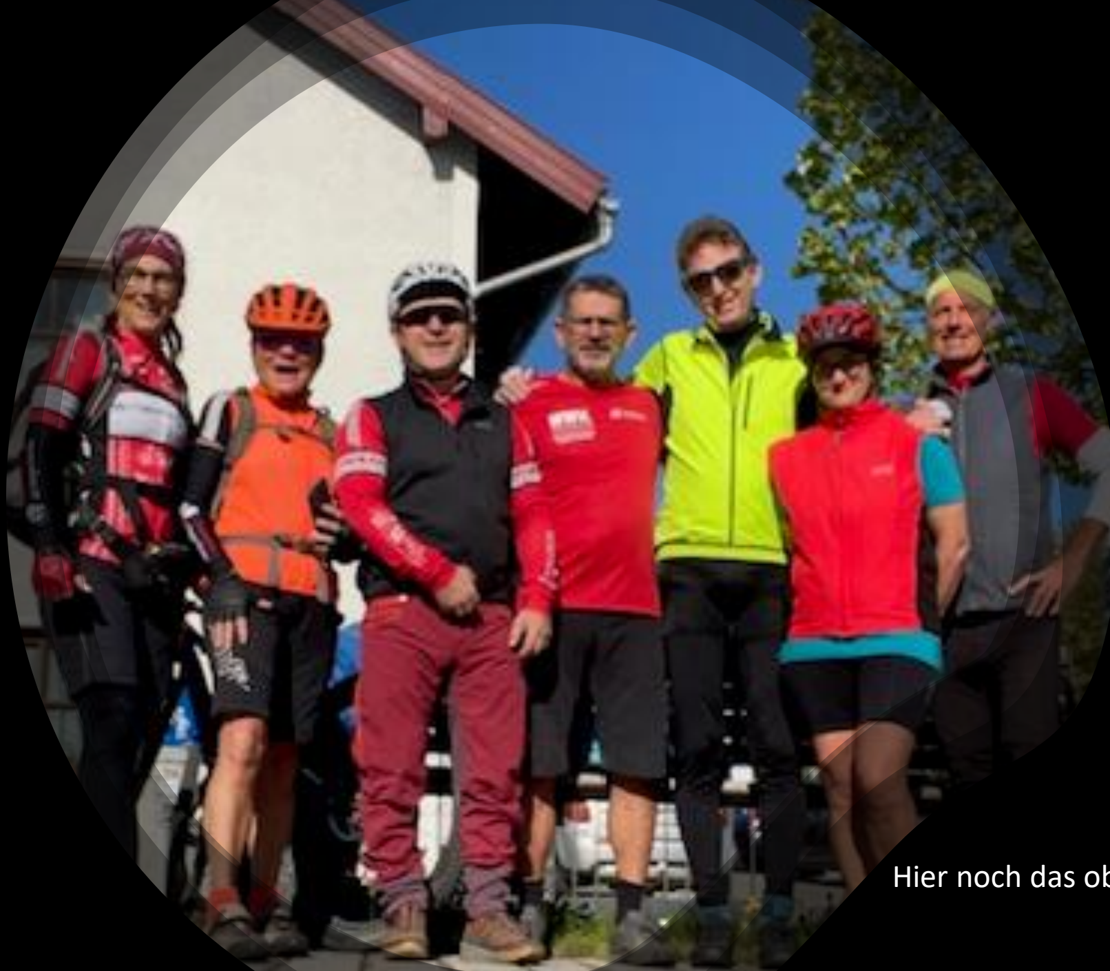
Hier noch das obligatorische Startfoto