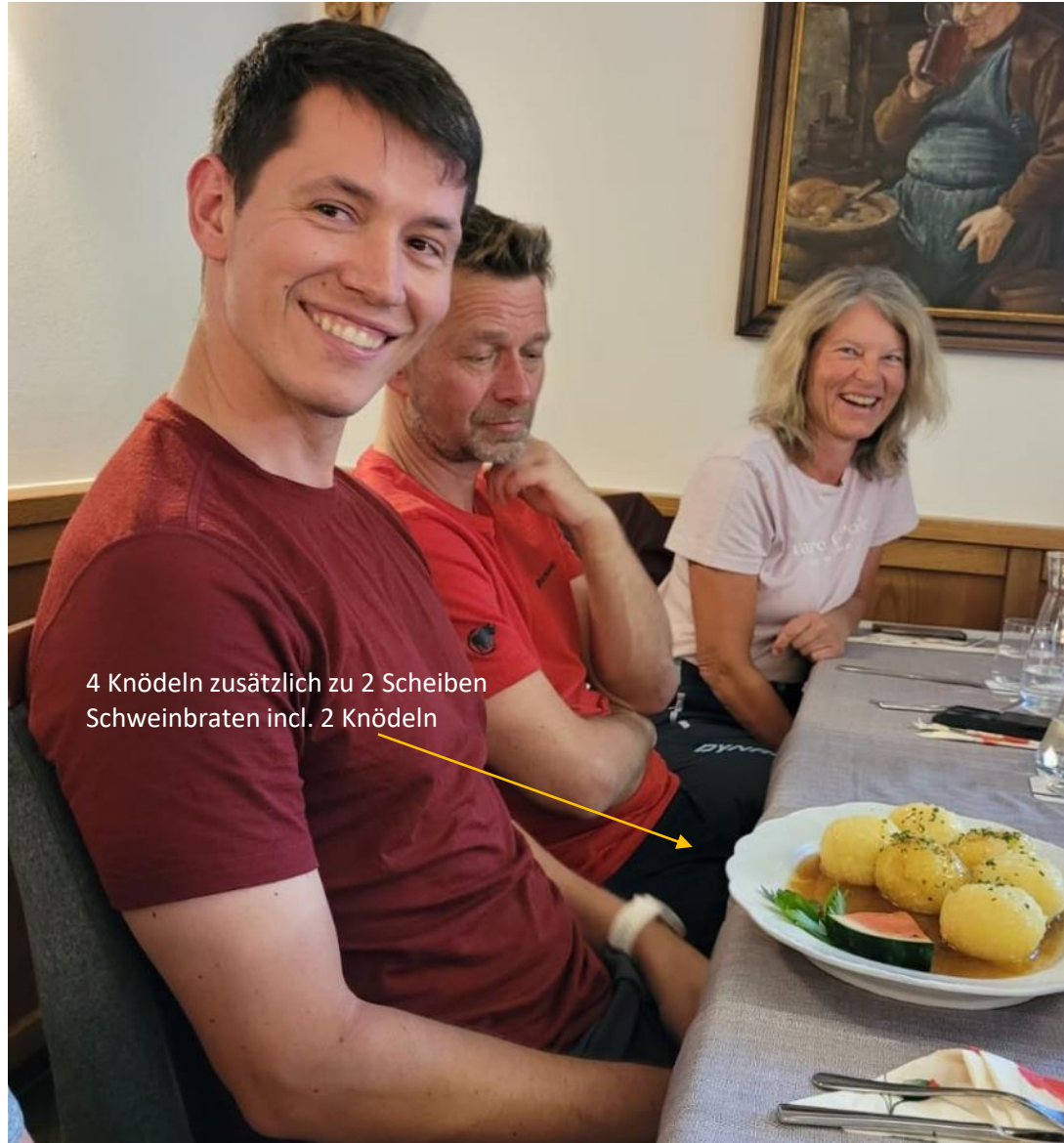
4 Knödeln zusätzlich zu 2 Scheiben Schweinbraten incl. 2 Knödeln