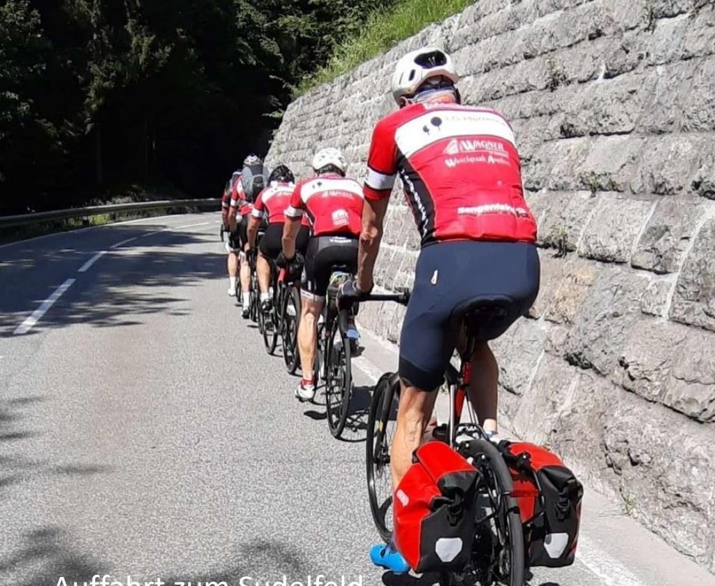
Auffahrt zum Sudelfeld